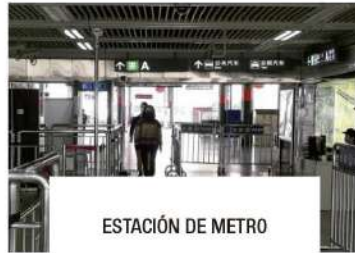
ESTACIÓN DE METRO