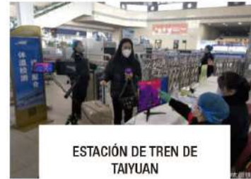
ESTACIÓN DE TREN DE TAIYUAN