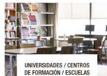
UNIVERSIDADES / CENTROS DE FORMACIÓN / ESCUELAS