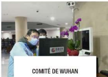
COMITÉ DE WUHAN