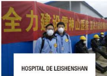
HOSPITAL DE LEISHENSHAN