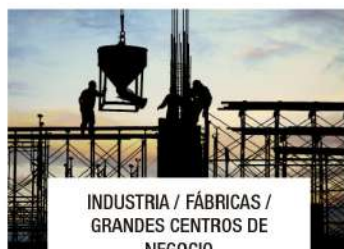
INDUSTRIA / FÁBRICAS / GRANDES CENTROS DE NEGOCIO