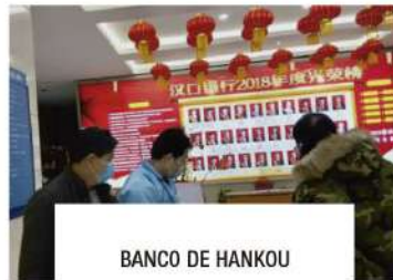
BANCO DE HANKOU