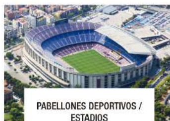
PABELLONES DEPORTIVOS / ESTADIOS