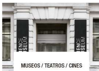
MUSEOS / TEATROS / CINES