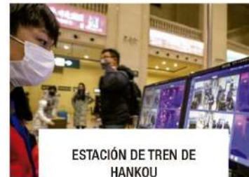
ESTACIÓN DE TREN DE HANKOU

Precios de venta al público IVA no incluido . Contacte con nuestro departamento comercial para obtener más información y consultar descuentos.