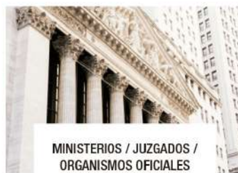
MINISTERIOS / JUZGADOS / ORGANISMOS OFICIALES