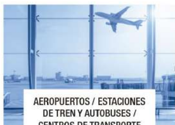
AEROPUERTOS / ESTACIONES DE TREN Y AUTOBUSES / CENTROS DE TRANSPORTE