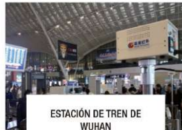
ESTACIÓN DE TREN DE WUHAN