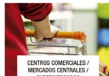
CENTROS COMERCIALES / MERCADOS CENTRALES / SUPERMERCADOS