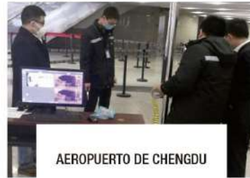
AEROPUERTO DE CHENGDU