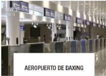
AEROPUERTO DE DAXING