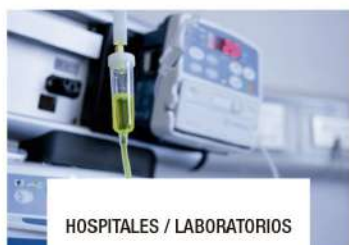
HOSPITALES / LABORATORIOS